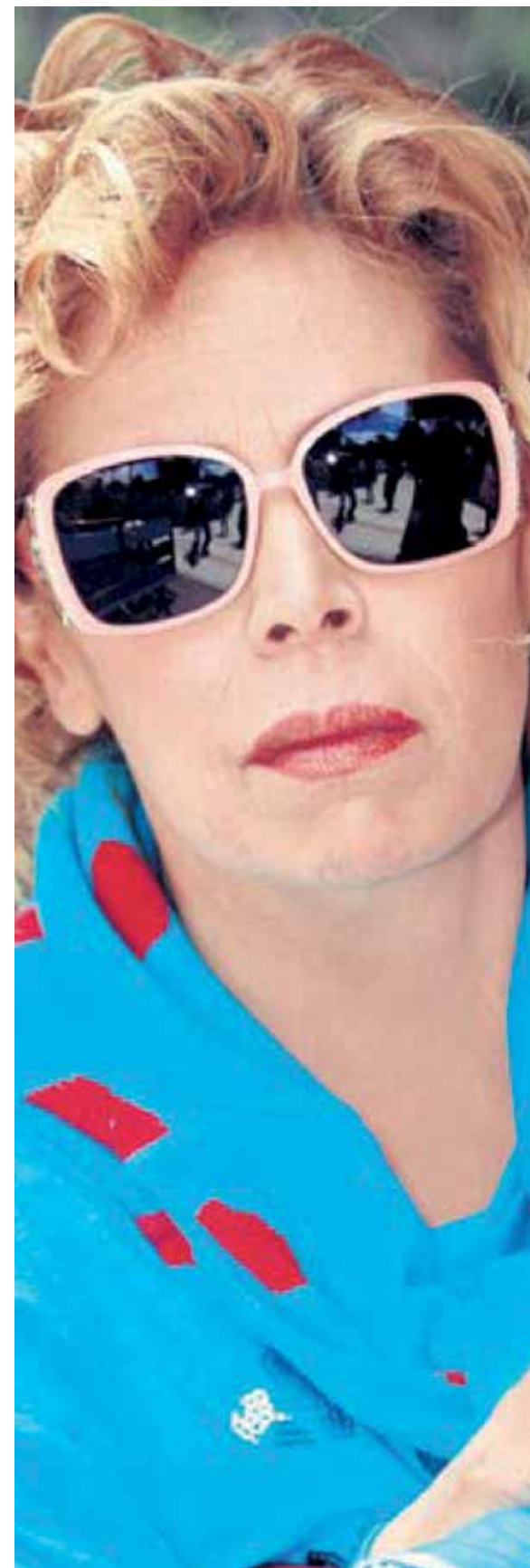
Por iniciativa propia, invitó a los silleteritos a posar con ella.