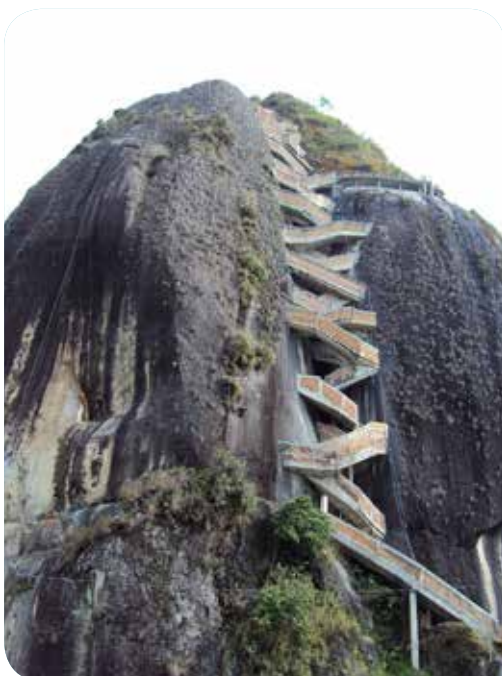
La piedra del Peñol

La mejor energía y disposición para divertirse al máximo y sonreír todo el tiempo