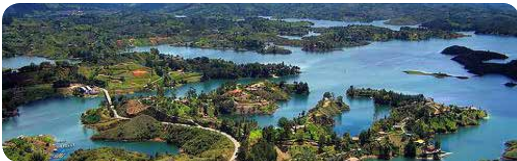
La temperatura promedio del parque es de 19 grados centígrados

A 73 kilómetros de Medellín y a dos kilómetros de la cabecera del municipio está el parque recreativo Comfama Guatapé.