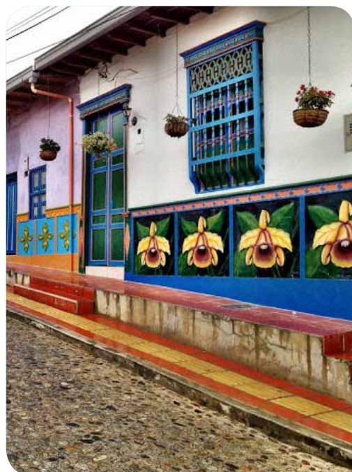
Típica casa de Guatapé