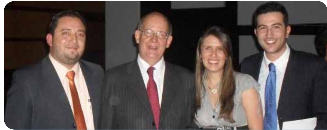
Medellín, 14 de marzo del 2013