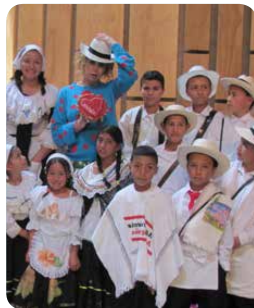
Invitó a los silleteritos a posar con ella