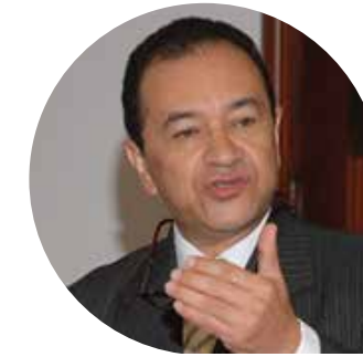
Por: Oswaldo León Castaño

(Testimonio de un niño participante del Programa Ahorro Escolar, de la Fundación Confiar).